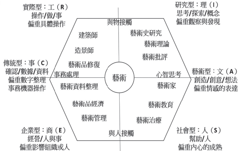
圖 2 視覺藝術精進專業之生涯興趣六角模型。

A 與另一類型同時獲得良好發揮的情境下，得以持續從事某項特定的視覺藝術精進專業，且能在職業生涯上發揮專業生涯之潛力。