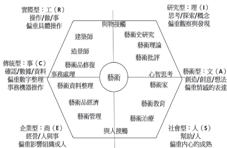
圖1 視覺藝術精進專業六角模型

根據Prediger(1982)對六角模型提出的人與事之行業特質象限概念，Holland(1985)生涯六角模型的概念，以及黃素菲(2014)認為每一個專業當中都可以找到生涯小六碼的說明，江學滢(2020)針對資深藝術精進專業者所做的研究，提出一個藝術精進專業六角模型的假設，指出所有的視覺藝術相關行業中存在著何倫小六碼的情況。例如，喜愛動手操作的實用型特質之視覺藝術專業可能是設計、電腦繪圖應用等，能大量閱讀並收集整理資料的研究型可能是藝術史、美學、美術理論研究等，能夠將感受以創意表達的藝術型是創作者，喜歡與人工作的社會型可以從事藝術教育、藝術治療這類需要大量人際互動的職業，具有組織管理能力的企業型可以從事藝術行政與藝術品經濟的工作，有耐心整理文件的事務型則可從事藝術相關基礎行政與資料處理的工作(圖1)。如果應用這個視覺藝術精進專業之何倫小六碼的概念進入學齡階段的藝術才能美術班之生涯探索中，也許能拓展學生創作學習以外的專業生涯之視野。然而，學齡階段的視覺藝術學習者之學習環境單純，許多學習者也單純因為喜歡畫畫而進入藝術才能美術班就讀。這類精進專業的生涯探索與訊息之提供，若由沒有受過視覺藝術和生涯輔導專業訓練的老師帶領，可能很難體會視覺藝術專長之下，還能有這些職涯發展方向。