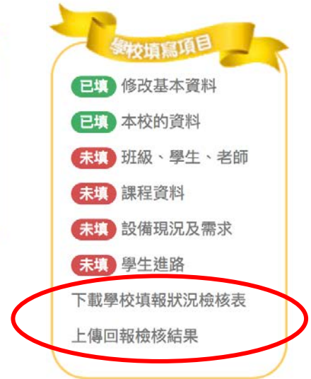
國立學校新增兩項目