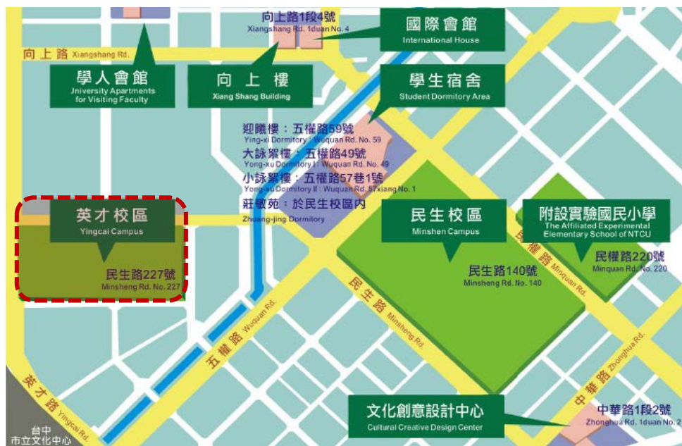
英才路 589 巷 Ln. 589, YingCai Rd.